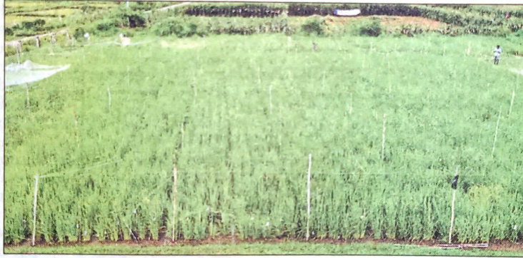
Paddy varieties grown for research at VC Farm near Mandya city.

The zonal agricultural research centre under the canopy of University of Agricultural Sciences-Bangalore, located at VC Farm in Mandya taluk, has conducted a significant research by cultivating 11,290 varieties of paddy at one place.