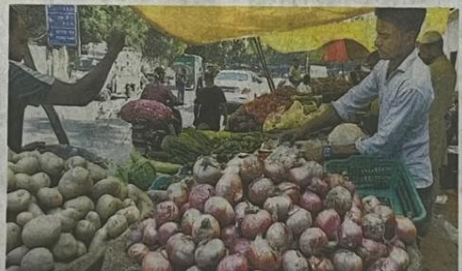
Pocket unfriendly: Potato and onion prices were up 78.1% and 78.8%, respectively, in September.

Inflation in India's wholesale prices ticked up to 1.84% in September from 1.31% in August, with food prices surging to a two-year high of 9.5% from August's 10-month low of 3.3%, as vegetables became nearly 49% costlier, marking the sharpest surge in 14 months.