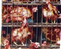
BATTERED: Battery chickens cannot stand

Firstly, we have the capacity to make choices about what we eat — humans are omnivores and can be very healthy as vegetarians or vegans. A tiger simply