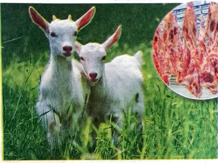
BORN FREE — BUT CRUELY AWAITS THEM: All animals are made to live free lives but humans ensure many non-human beings live in cages and end in slaughterhouses

cannot live without eating other animals. Also, environmentally, we have developed this immense technological ability to change the entire planet — we burn massive amounts of fossil fuels and are altering Earth's atmospheric balance. We deforest huge tracts of land — other animals don't have the ability to change planetary systems in the way we are doing. Our speciesism and preying on other animals is much more significant than predators existing in nature.