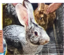
USE YOUR CHOICE: Animal testing is used even to make shampoo and paint

Absolutely. There is no doubt that these animals are enslaved and treated as objects for our gain. In chicken produc-