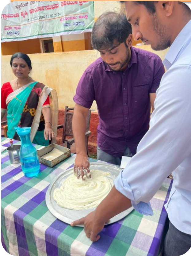
Creaming process for cake