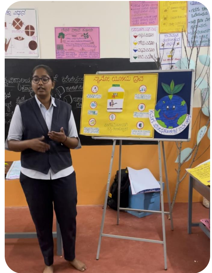
Importance of nanourea and dosage, method of application of nanourea