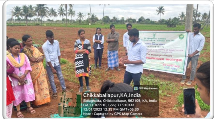
Importance of azolla