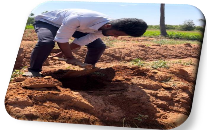
Sub sample collecting