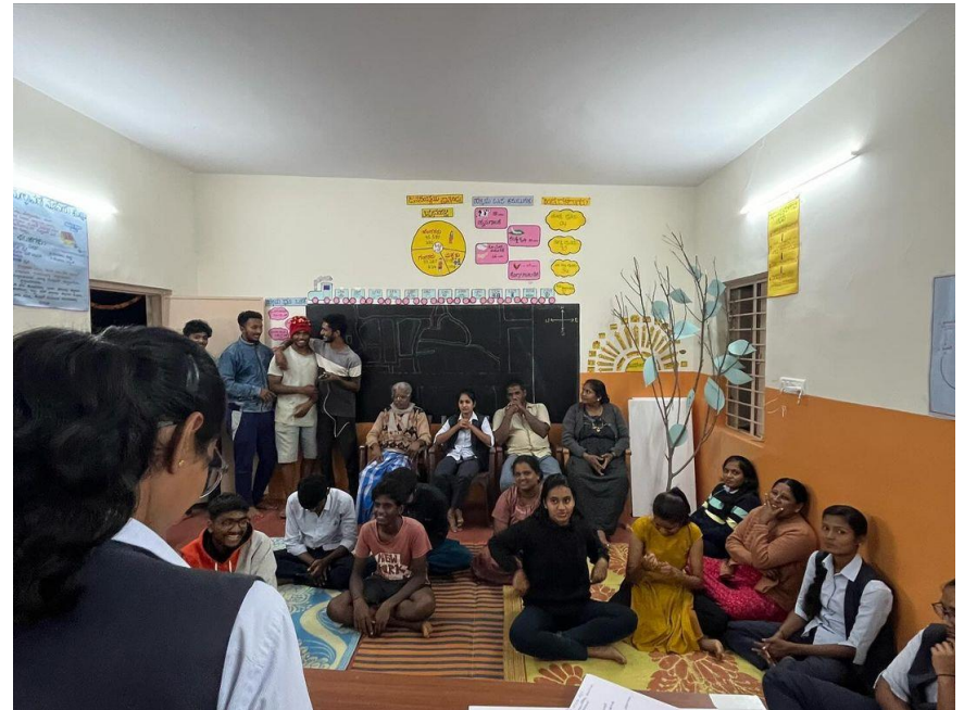
Different practices for weed management