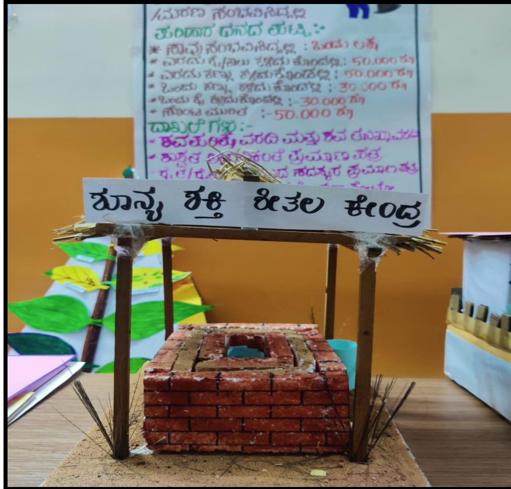
Model of ZECC it's importance and uses