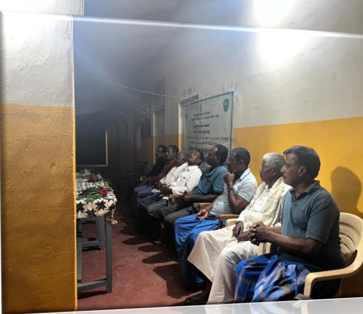
Welcomed village leaders