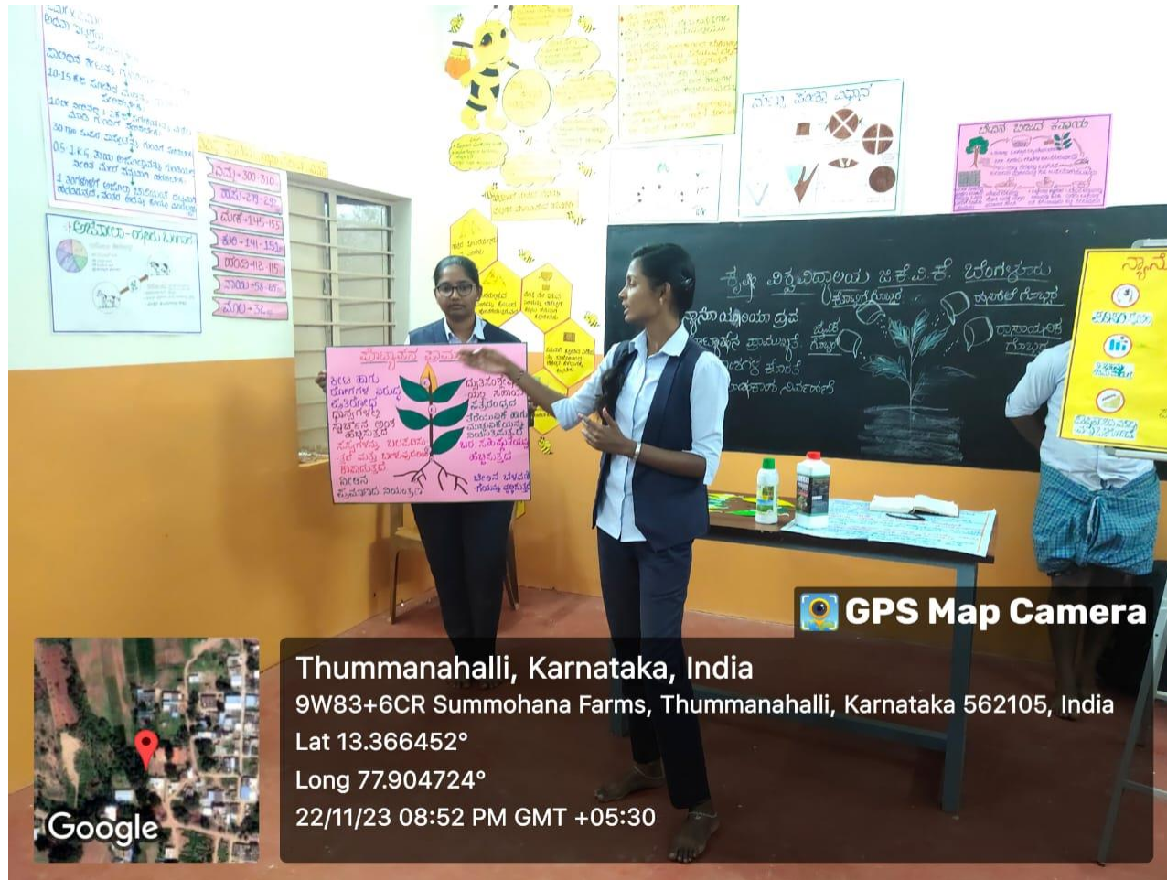
Giving awareness regarding use of potash fertilizer