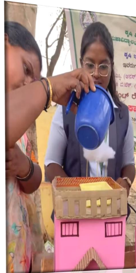
Working model on rain water harvesting and it's Importance