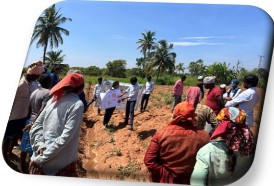
Importance of soil sampling