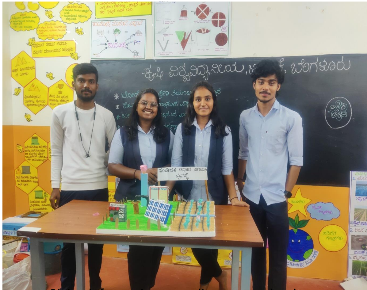
Giving information regarding new technology “sensor based irrigation system “