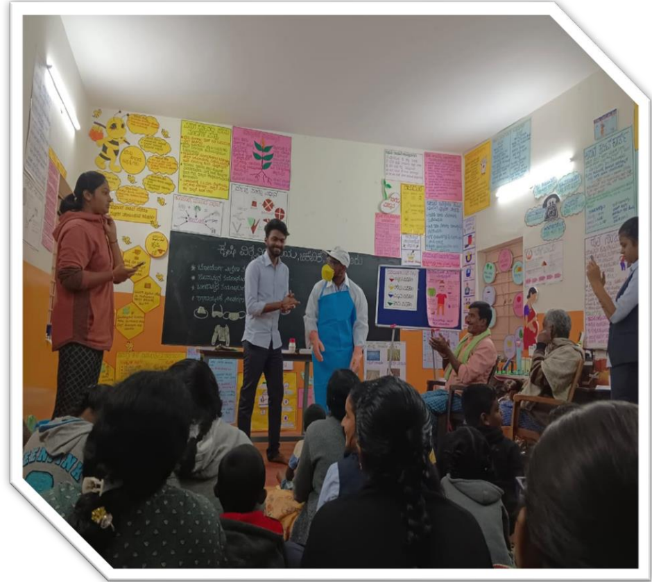
Displaying how to protect ourselves while spraying