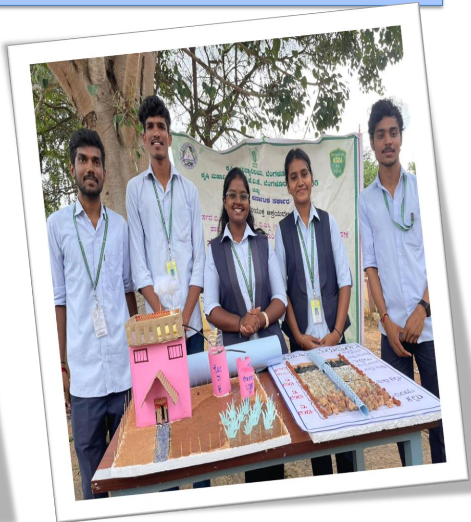
Awareness regarding tubewell recharge and it's uses