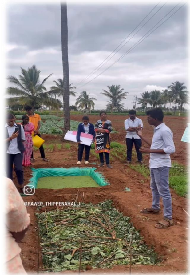
Method demonstration of vermicompost and it's importance