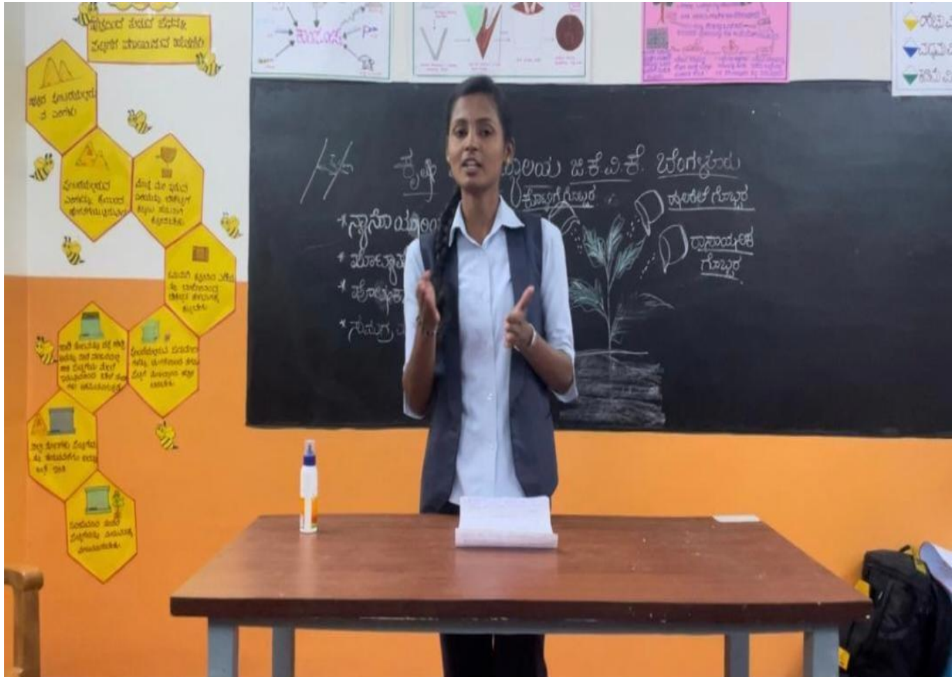
Giving awareness regarding using of different sources of nutrients