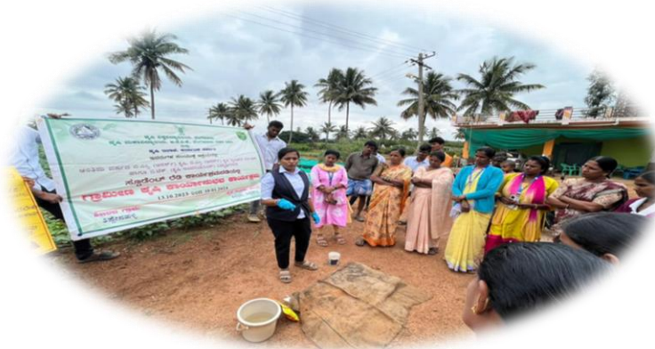
Covering with gunnybag to maintain moisture