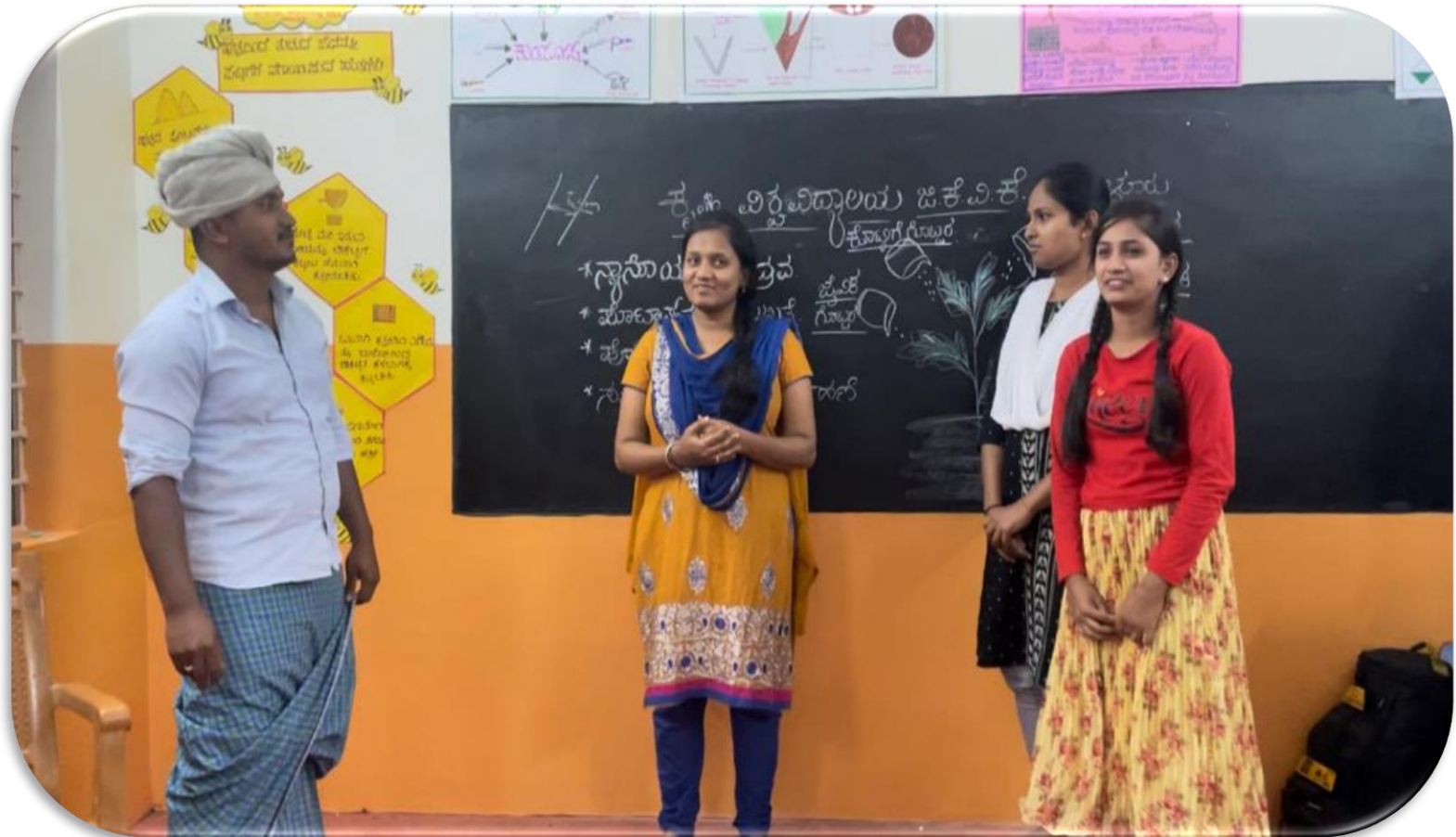
Reaching farmers through skit on INM