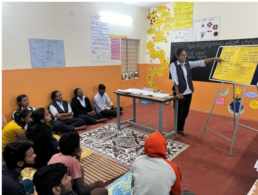
Role of weeds in decreasing yields