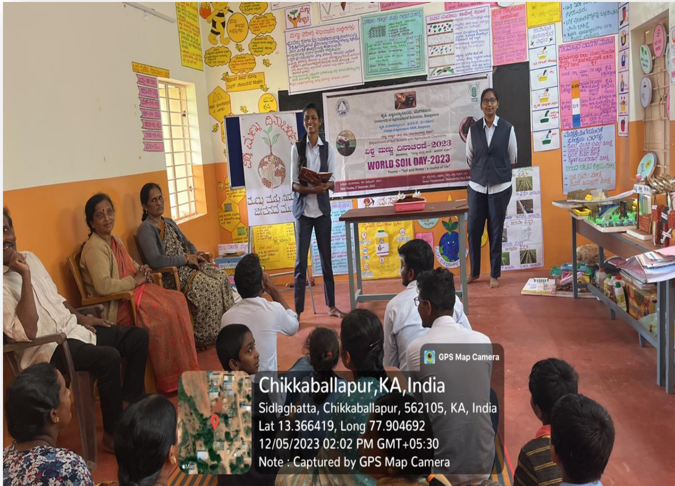
Awareness regarding importance of soil