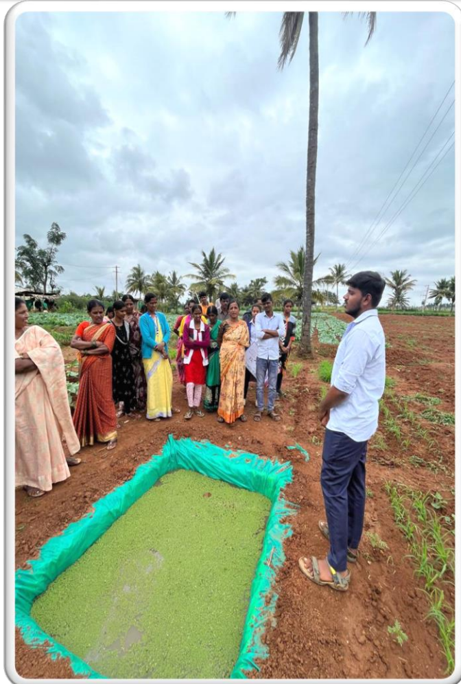
Method demonstration of azolla cultivation