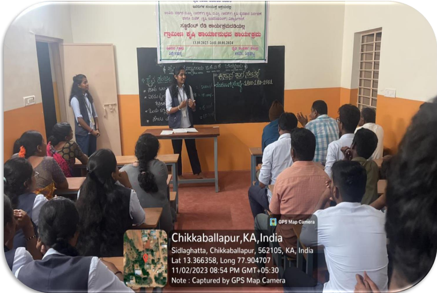
Awareness regarding kissan call centre