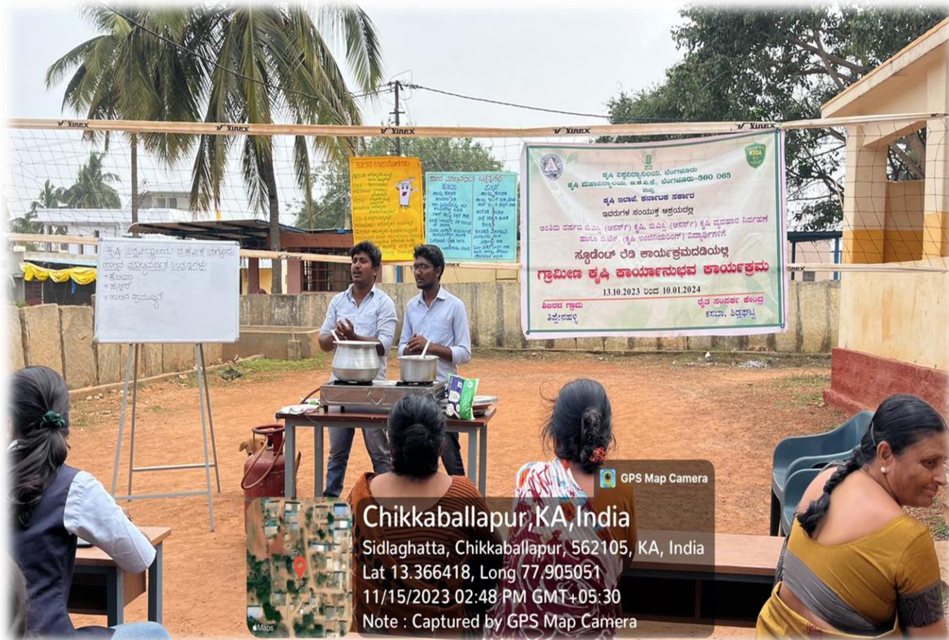
Method demonstration of value added product like kova and panner