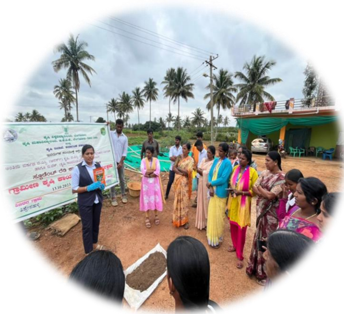
Importance of Trichoderma