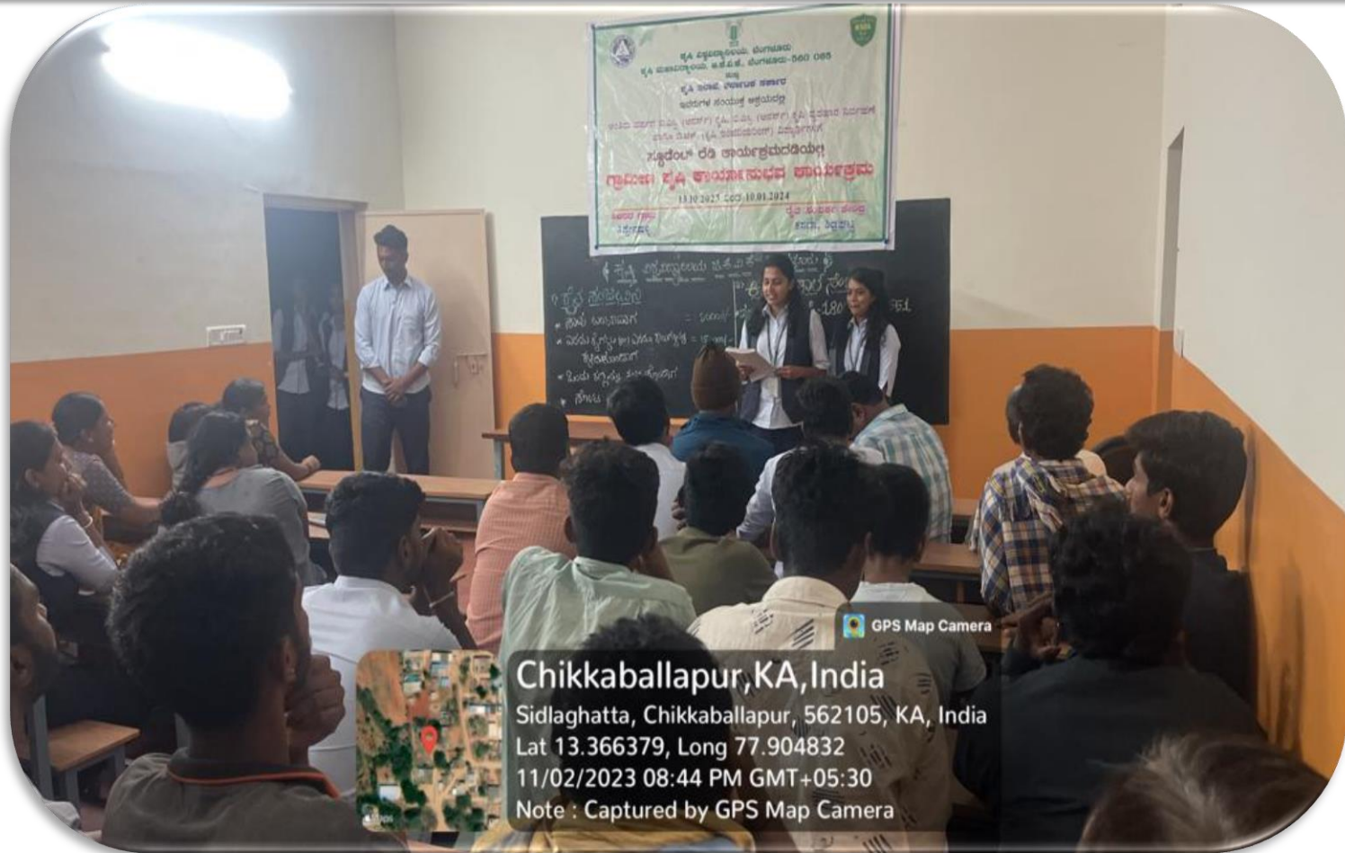
Importance of Raita sanjeeveni