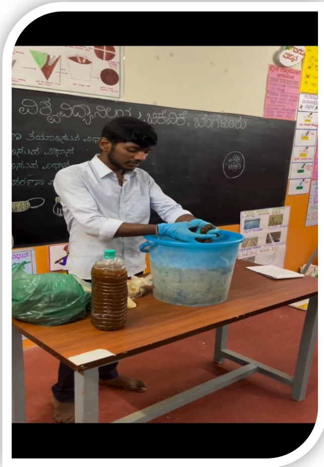
Method demonstration of jeevamrutha preparation