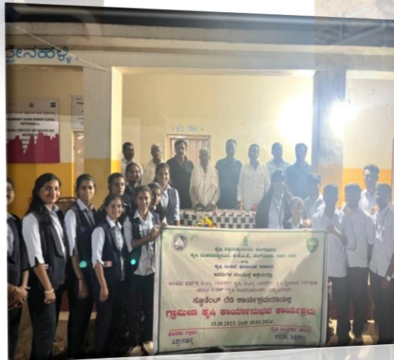
Gave information regarding our RAWE camp and what are the activities to be conducted.