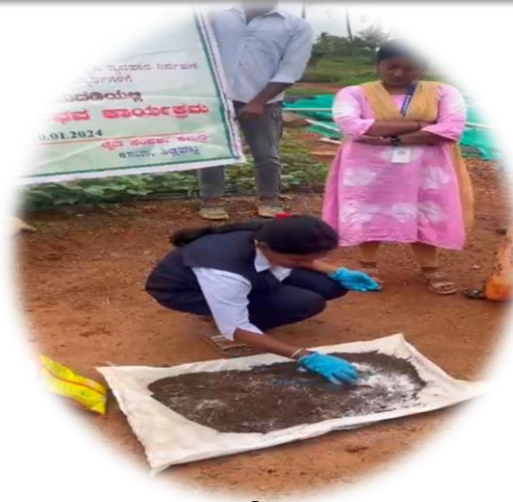
Mixing of Trichoderma with fym