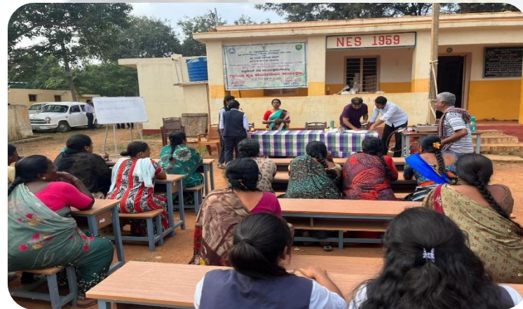
Giving information regarding different training programme in bakery unit