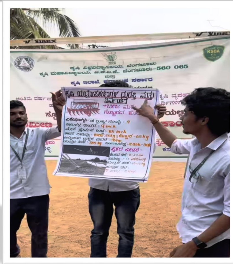
Importance of care and maintenance of machinery