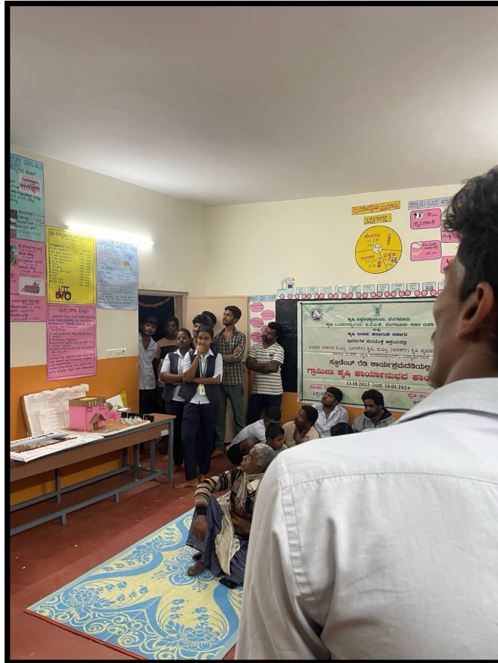
Custom hiring centre and prices for different implements