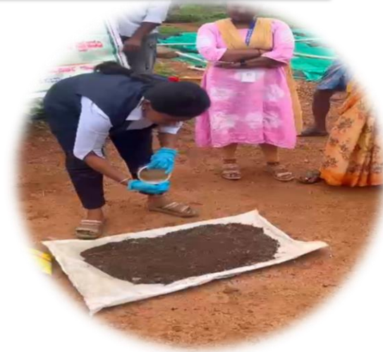
Sprinkling of water