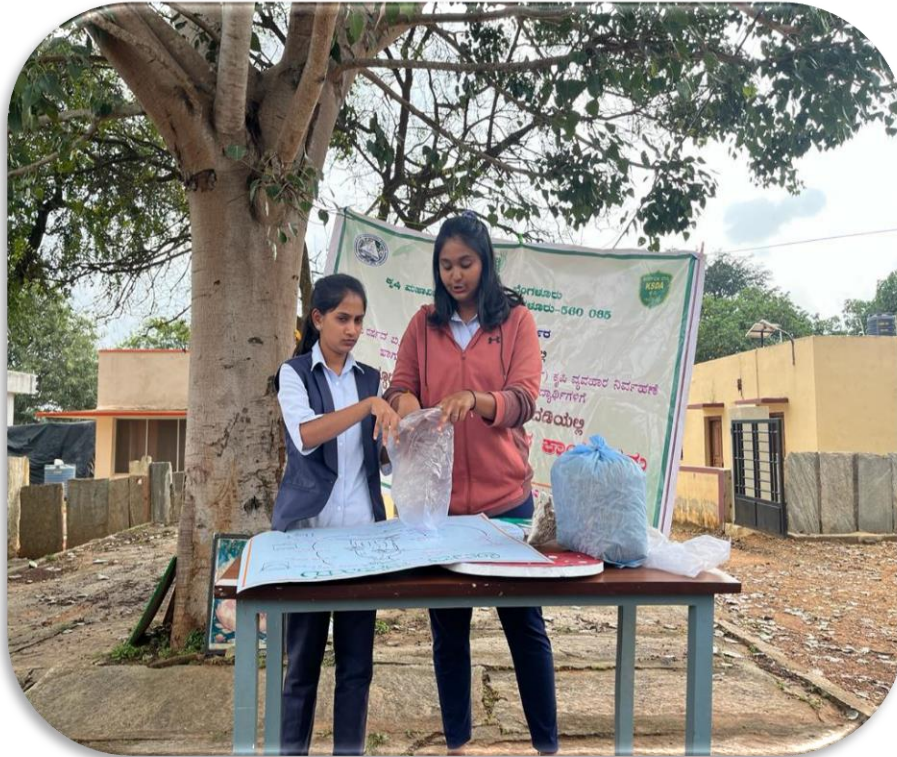
Method demonstration of mushroom cultivation