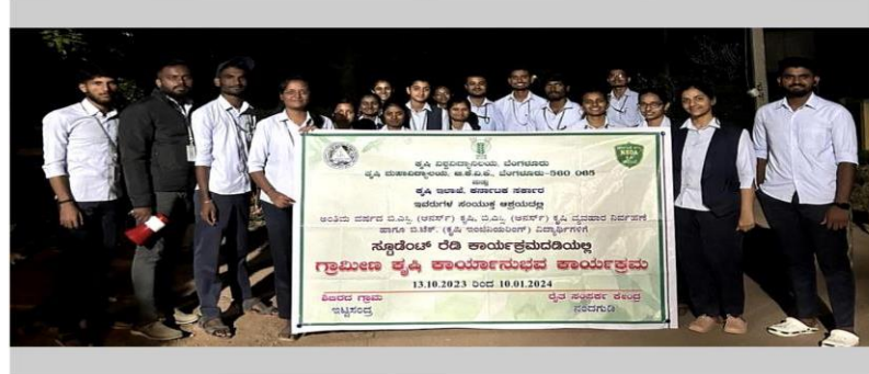
ಹೊಸಕೋಟೆ ತಾಲ್ಲೂಕಿನ ಇಟ್ಟಸಂದ್ರ ಗ್ರಾಮದಲ್ಲಿ ಗಾಂಧಿ ಕೃಷಿ ವಿಜ್ಞಾನ ಕೇಂದ್ರದಿಂದ ಕೃಷಿ ಕಾರ್ಯಾನುಭವ ಹಮ್ಮಿಕೊಳ್ಳಲಾಗಿತ್ತು

ಹೊಸಕೋಟೆ: ಕೃಷಿ ವಿಶ್ವವಿದ್ಯಾಲಯ ಬೆಂಗಳೂರು, ಗಾಂಧಿ ಕೃಷಿ ವಿಜ್ಞಾನ ಕೇಂದ್ರ, ಕೃಷಿ ಇಲಾಖೆ ಆಶ್ರಯದಲ್ಲಿ ಅಂತಿಮ ವರ್ಷದ ಬಿಎಸ್ಸಿ (ಆನರ್ಸ್), ಕೃಷಿ ಬಿಎಸ್ಸಿ (ಆನರ್ಸ್), ಕೃಷಿ ವ್ಯವಹಾರ ನಿರ್ವಹಣೆ ಹಾಗೂ ಬಿ.ಟೆಕ್ (ಕೃಷಿ ಎಂಜಿನಿಯರಿಂಗ್) ವಿದ್ಯಾರ್ಥಿಗಳಿಗೆ 90 ದಿನಗಳ ಗ್ರಾಮೀಣ ಕೃಷಿ ಕಾರ್ಯಾನುಭವ ಕಾರ್ಯಕ್ರಮ ಹಮ್ಮಿಕೊಳ್ಳಲಾಗಿದೆ.