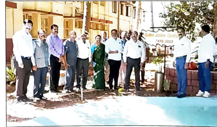
ಸುವರ್ಣ ಮಹೋತ್ಸವ ಉದ್ಘಾಟನ

ಹೆಚ್ಚಿನ ಮಾಹಿಗಾಗಿ ಸಂಪರ್ಕಿಸಿ ಒರಿಯ ಕ್ಷೇತ್ರ ಅಧೀಕ್ಷಕರು ವಲಯ ಕೃಷಿ ಸಂಶೋಧನಾ ಕೇಂದ್ರ, ಜಿ.ಕೆ.ವಿ.ಕೆ., ಬೆಂಗಳೂರು ಮಿಂಚಂಚೆ: sfsqkvkb@gmail.com ದೂರವಾಣಿ: 080-23330153 / ವಿಸ್ತರಣೆ: 315 ಜಂಘಮವಾಣಿ: 9449864251