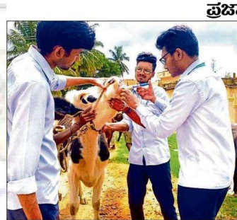
ದೊಡ್ಡಬಳ್ಳಾಪುರ ತಾಲ್ಲೂಕಿನ ಮರಳಕುಂಟೆ ಗ್ರಾಮದಲ್ಲಿ ಚಿಕಿತ್ಸೆಯಿಂದ ನಡೆದ ಗ್ರಾಮೀಣ ಕೃಷಿ ಕಾರ್ಯಕ್ರಮದ ಅಂಗವಾಗಿ ಬರಹ ರಾಮಗಳ ತವಾವಣಿ ಹಾಗೂ ಪಶು ಆರೋಗ್ಯ ಚಿಕಿತ್ಸಾ ಶಿಬಿರ ನಡೆಯಿತು